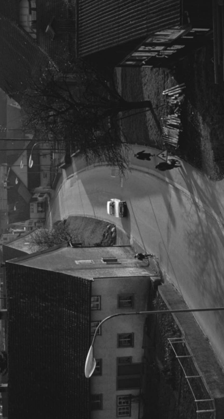
Landstrasse im Abschnitt zwischen Lättenstrasse und Juchstrasse (1960er Jahre)