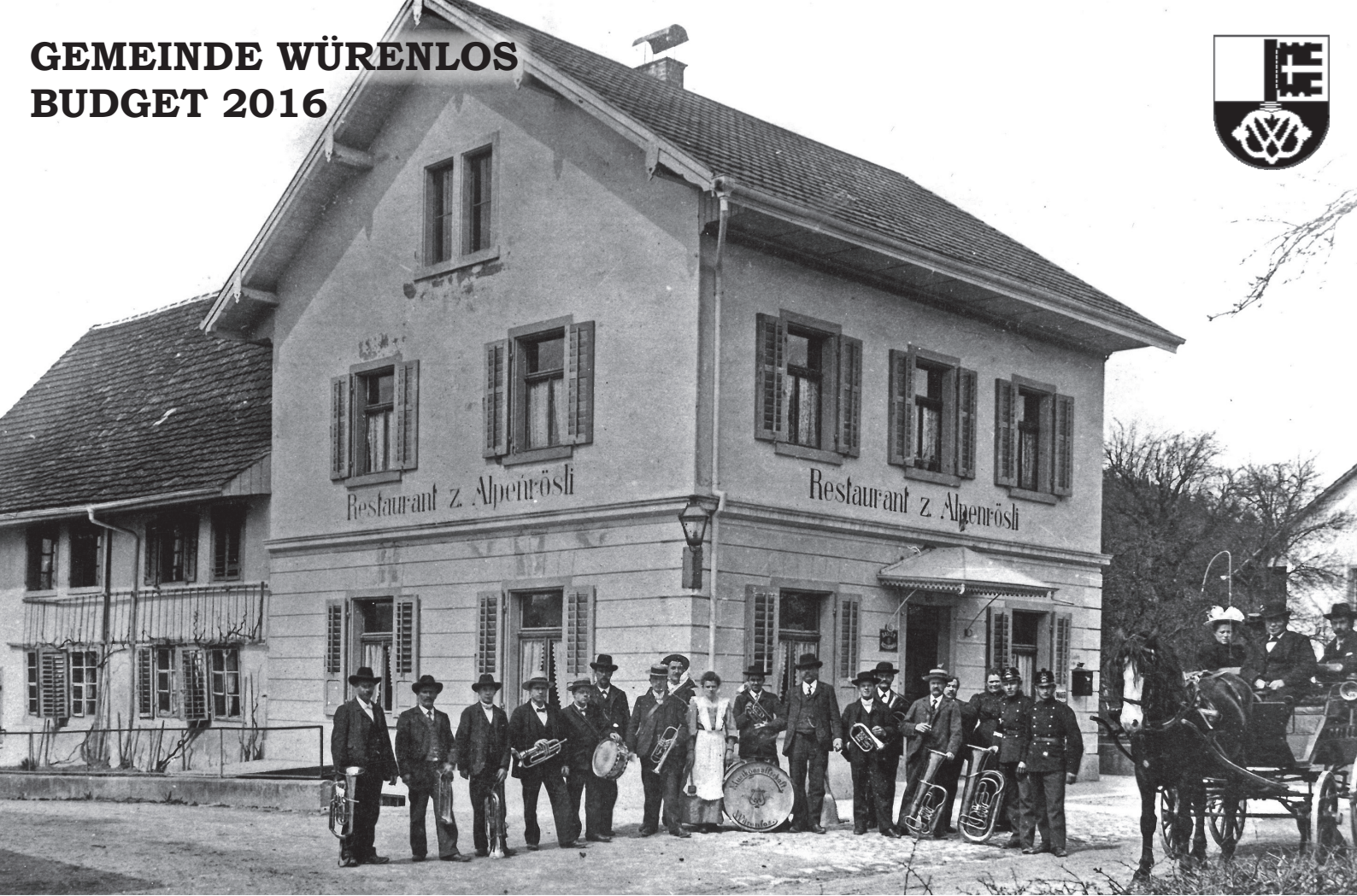
Musikgesellschaft Würenlos posiert vor dem Restaurant «zum Alpenrösli» (um 1905)