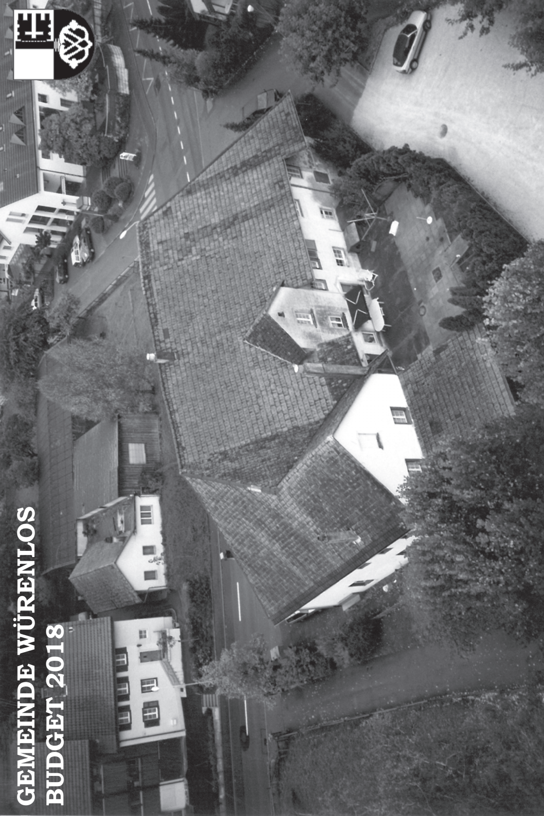
Blick vom Kirchturm auf die "Chilemetzg" und die Einfahrt zum Ländliweg (Aufnahme 1998)