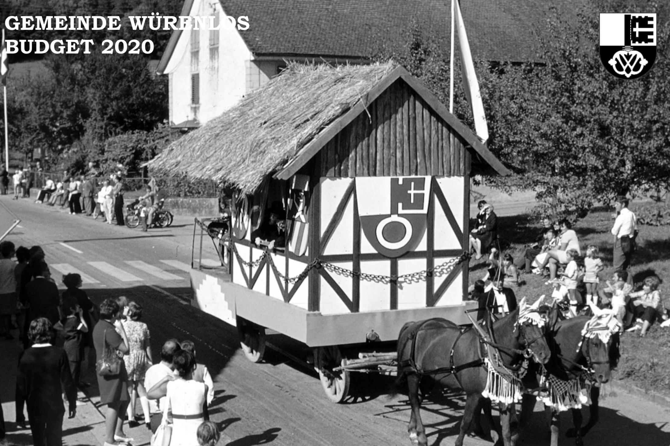
Festumzug anlässlich der 1100-Jahr-Feier der Gemeinde Würenlos 1970