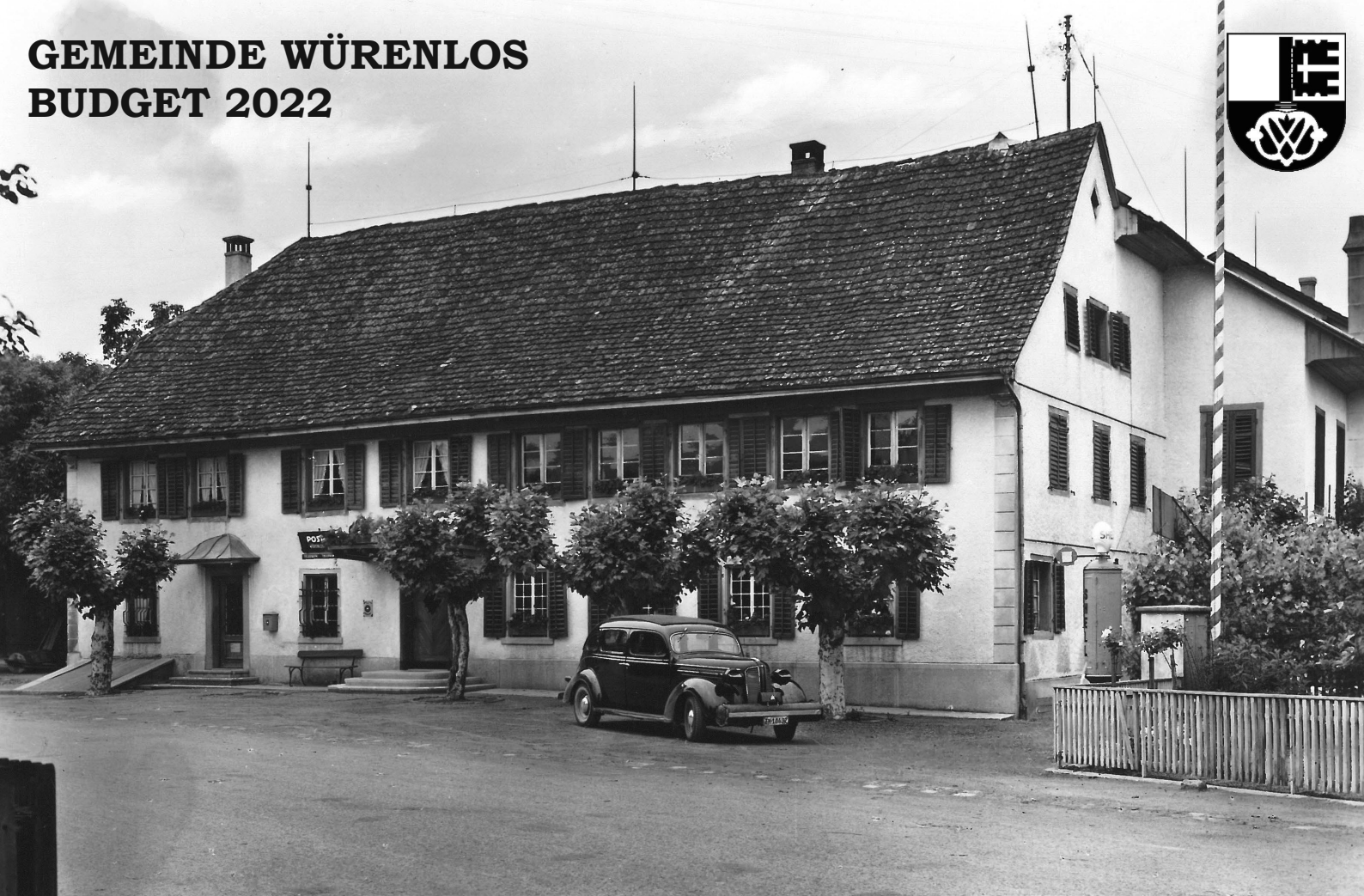
Gasthof «Rössli» mit der damaligen Poststelle (Eingang links) (Aufnahme aus der Zeit des 2. Weltkriegs)