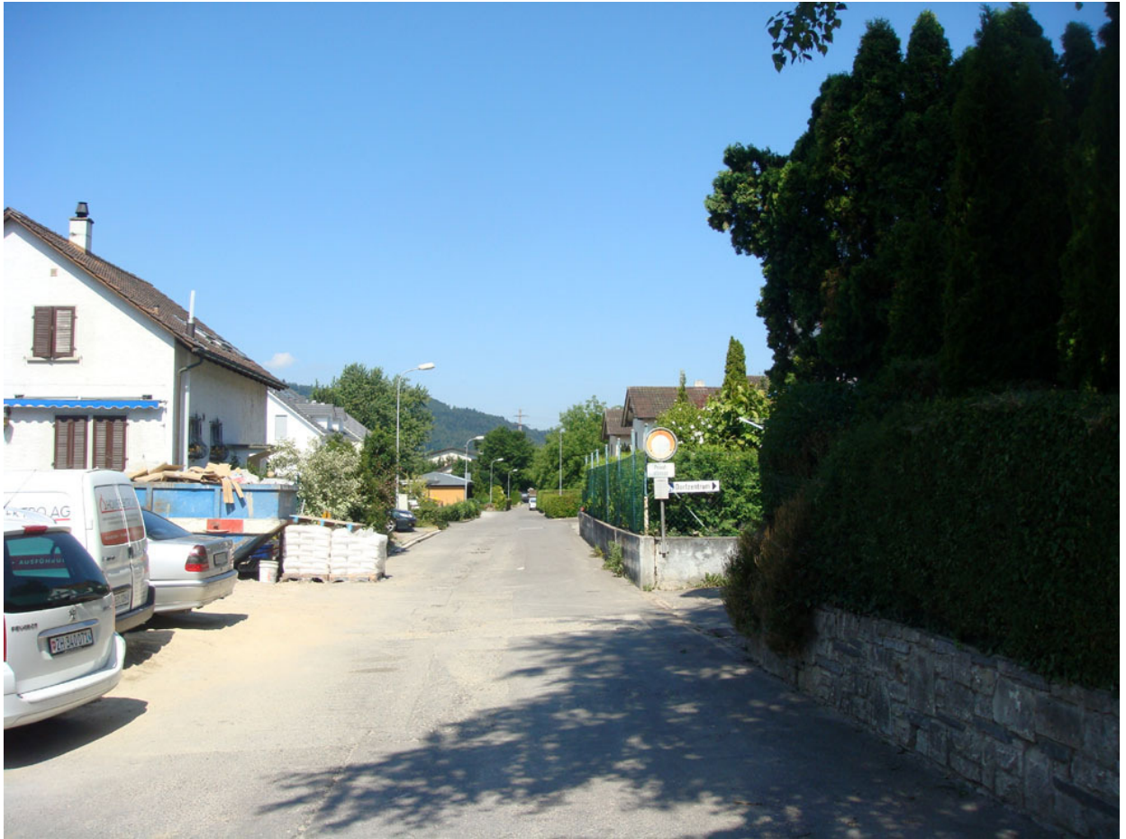
Wird in der 2. Jahreshälfte 2011 saniert: Der Schliffenenweg