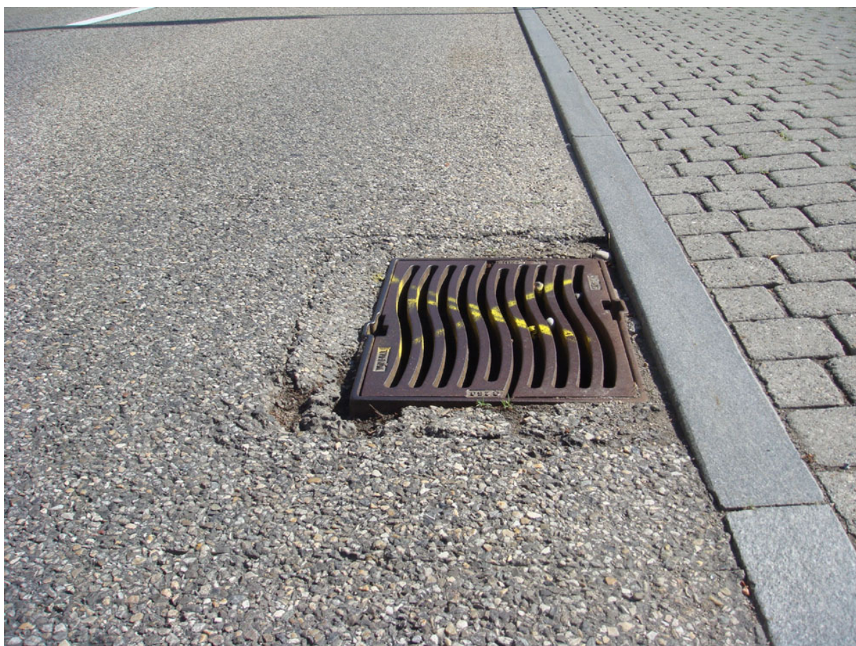
Weist nach 9 Jahren bereits grössere Belagsschäden auf: Die Schulstrasse

Am 29. August 2011 wird der Start zur Ausarbeitung des Betriebs- und Gestaltungskonzeptes der Schulstrasse erfolgen. Unter der Leitung des Departements Bau, Verkehr und Umwelt wird ein erfahrenes Planungsbüro die spezielle Situation der Schulstrasse untersuchen und Verbesserungen bezüglich Verkehr und Gestaltung ausarbeiten. Priorität wird die Sicherheit der Fussgänger und der Radfahrer haben. Über die Entwicklung des Betriebs- und Gestaltungskonzeptes wird der Gemeinderat die Bevölkerung orientieren.