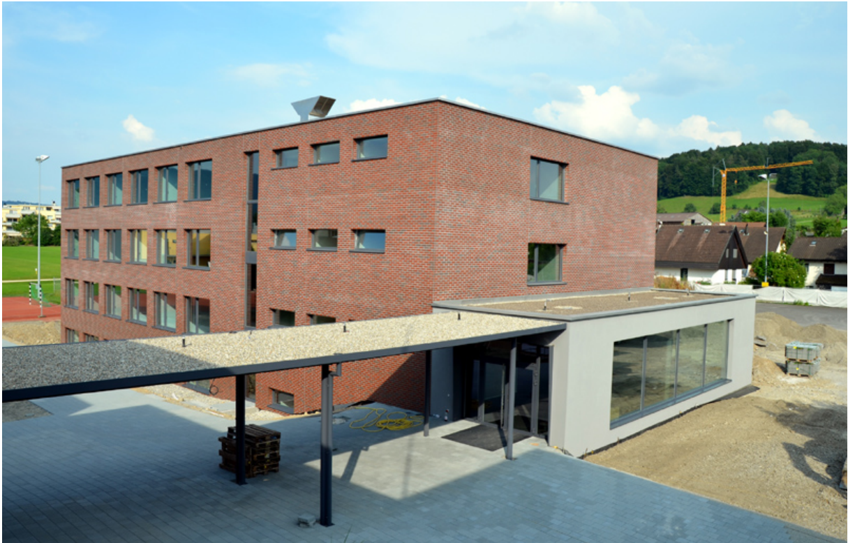
Der Neubau Schulhaus "Feld" ist abgeschlossen. Jetzt sind die Umgebungsarbeiten im Gang.