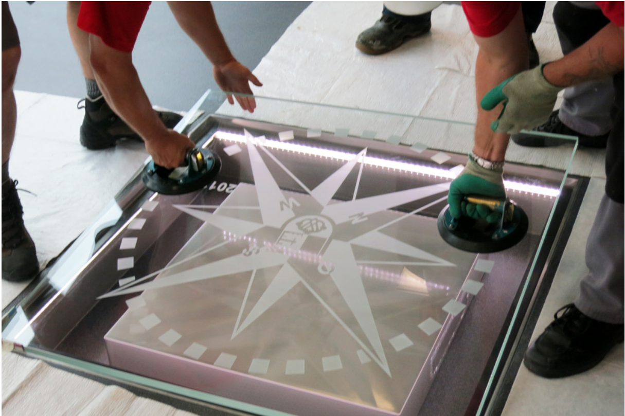
Die Glasplatte mit Windrose, Gemeindewappen und Jahrzahl 2012 (Baujahr) wird eingelassen. Sie bildet die Abdeckung des Grundsteins.

GEMEINDEKANZLEI WÜRENLOS Der Gemeindeschreiber