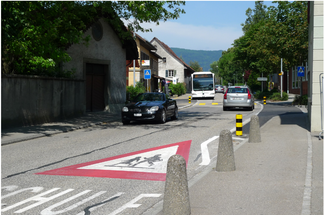
Neue Verkehrssituation mit verengter Fahrbahn beim Volg.

Seit 5. August 2013 gilt auf der Schulstrasse im Abschnitt zwischen Volg und Restaurant "Alpenrösli" eine neue Verkehrssituation. Die Strasse wurde im Bereich der Kreuzung Schulstrasse / Feldstrasse / Dorfstrasse verengt. Mit dieser Massnahme soll die Sicherheit der Fussgänger, insbesondere für Kinder und Jugendliche auf dem Schulweg, verbessert werden. Es handelt sich um eine einjährige Pilotphase.