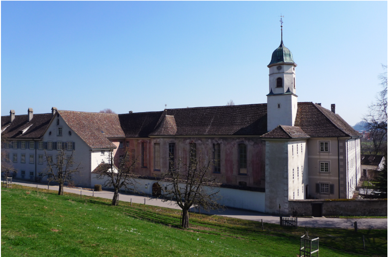
Kloster Fahr, Klosterkirche

GEMEINDEKANZLEI WÜRENLOS Der Gemeindeschreiber