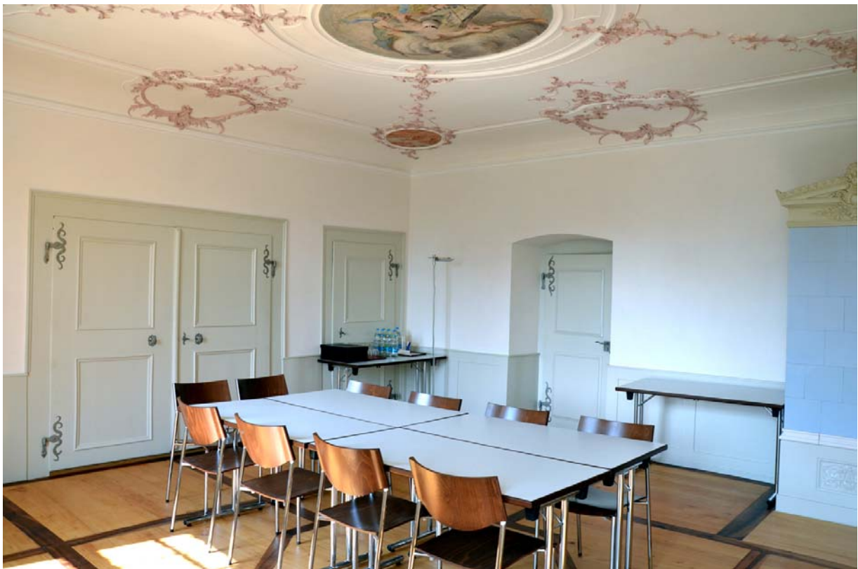
Raum "Vier Jahreszeiten"