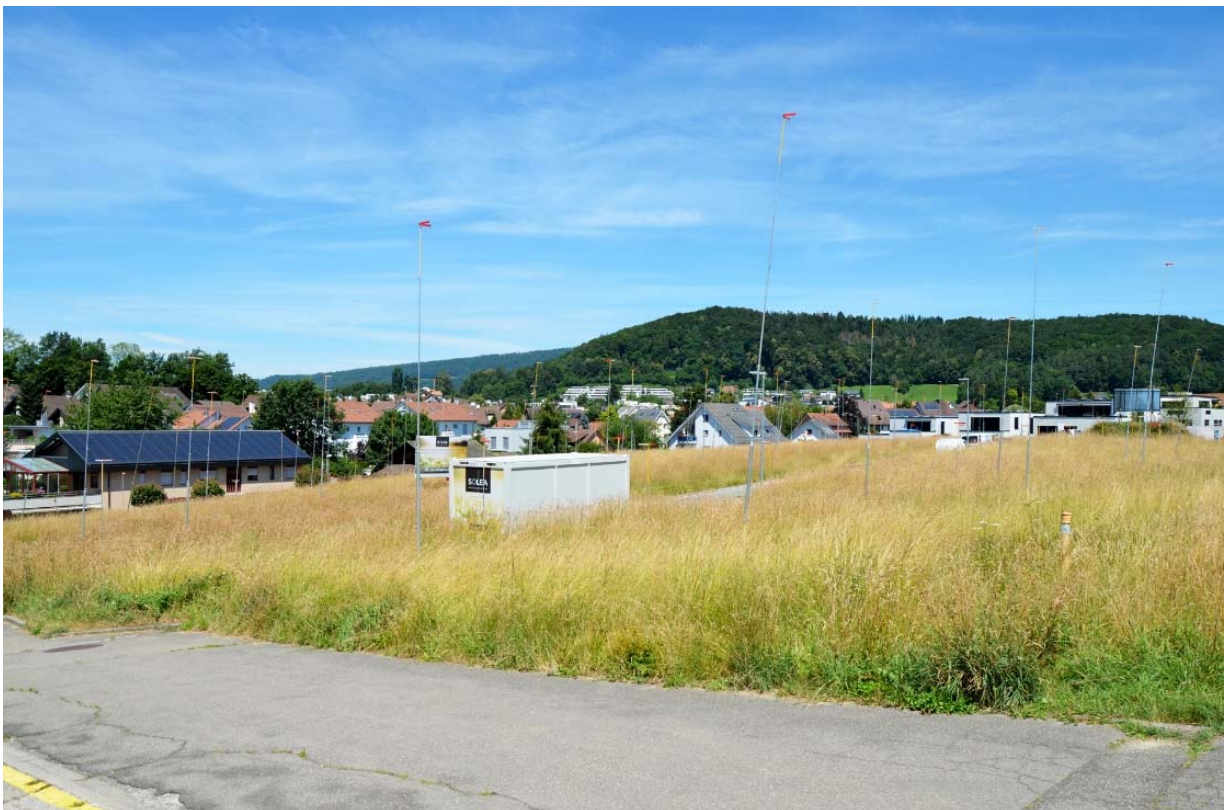
Planen und Bauen in Würenlos: Hier die Bauprofile beim "Huebacher"

Die aktualisierte BNO passt sich der "Interkantonalen Vereinbarung über die Harmonisierung der Baubegriffe" (IVHB) an und berücksichtigt sowohl neue übergeordnete Vorgaben (beispielsweise Hochwasserschutz, Gewässerräume, Verkaufsnutzungen, Mehrwertabgabe und Baupflicht) als auch spezifische Bedürfnisse der Gemeinde Würenlos, die sich unter anderem aus den Erfahrungen aus vergangenen Baubewilligungsverfahren ableiten.