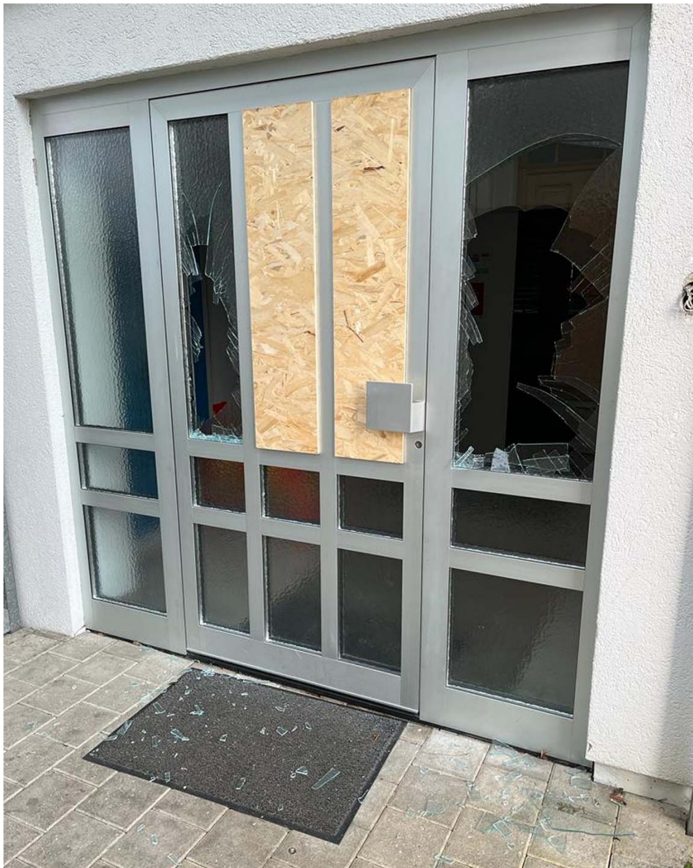
Silvester- oder Neujahrsvandalismus am Annexbau beim Reformierten Pfarrhaus: Zwei weitere eingeschlagene Scheiben. Die beiden anderen wurden zwei Wochen davor demoliert.

Die neuerlichen Schäden wurden am 2. Januar 2022 um 11 Uhr entdeckt. Die Schadenssumme beläuft sich auf gut zweitausend Franken. Die Gemeinde hat Anzeige bei der Polizei erstattet. Der Gemeinderat setzt eine Belohnung von 1'000 Franken aus für Hinweise, die zur Ermittlung der Täterschaft führen. Sachdienliche Hinweise nimmt die Gemeindekanzlei unter Telefon 056 436 87 20 oder gemeindekanzlei@wuerenlos.ch gerne entgegen. Die Hinweise werden vertraulich behandelt.