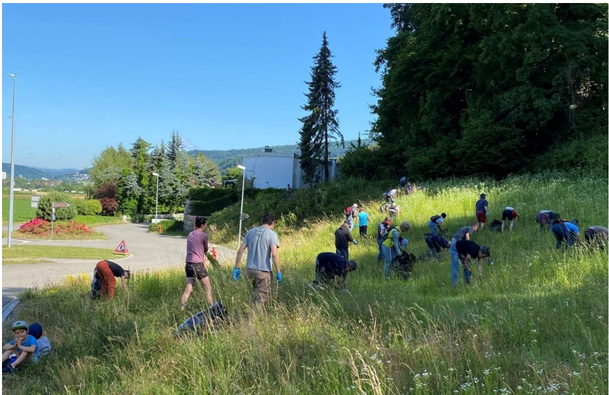
Die fleissigen Teilnehmer an der Arbeit

Fazit: Der Anlass war ein voller Erfolg und Anstoss dazu, solche Veranstaltungen zu wiederholen, da auch aus den Reihen der teilnehmenden Einwohner der Wunsch geäussert wurde, solche, zum Teil unbekannte, Themen aktiv der Bevölkerung näherzubringen. Der Gemeinderat dankt allen Teilnehmenden und den Organisatoren für ihren Einsatz.