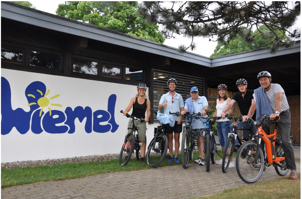
Mit dem Velo in die Badi "Wiemel" - die Schwimmbadkommissionsmitglieder machen's vor!

Die Besucher des Schwimmbads "Wiemel" sind aufgefordert, mit dem Velo zu kommen und die ausreichend vorhandenen Veloparkständer zu benutzen. Die Schwimmbadkommission dankt!