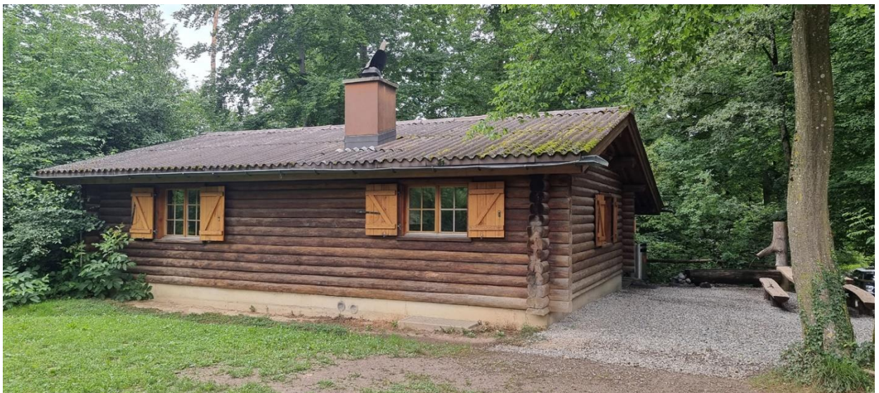
Forsthaus "Tägerhard", 1982 errichtet