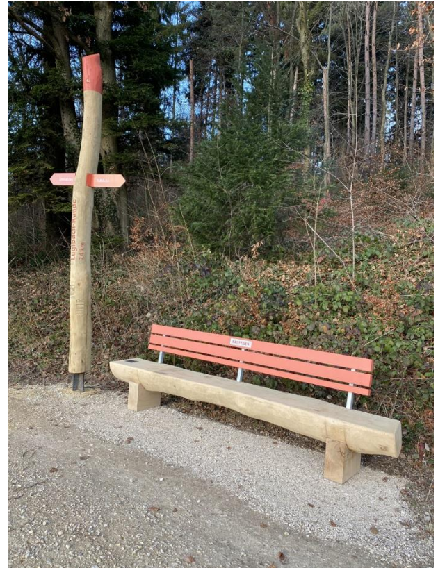
Sitzbank "Historische Wassergräben"