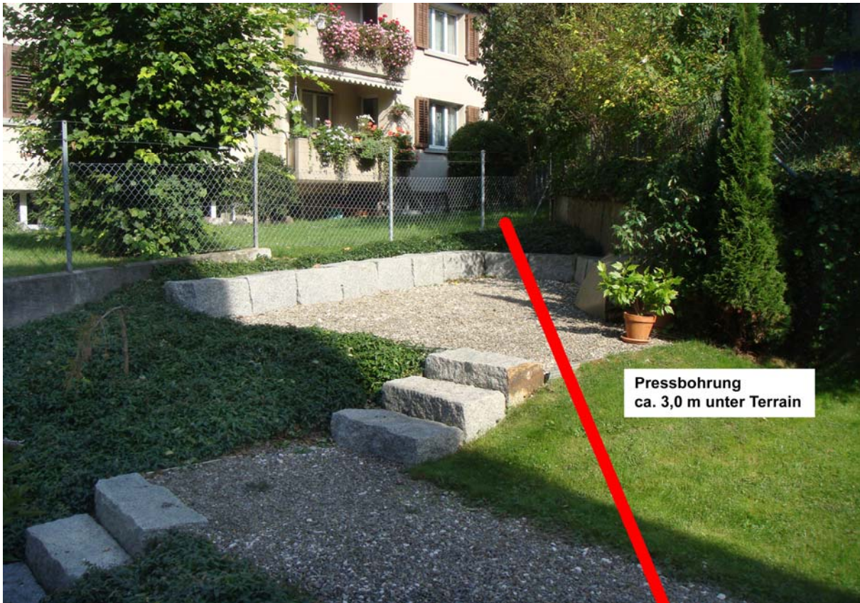
Lage der bestehenden Leitung im Stützmauerbereich