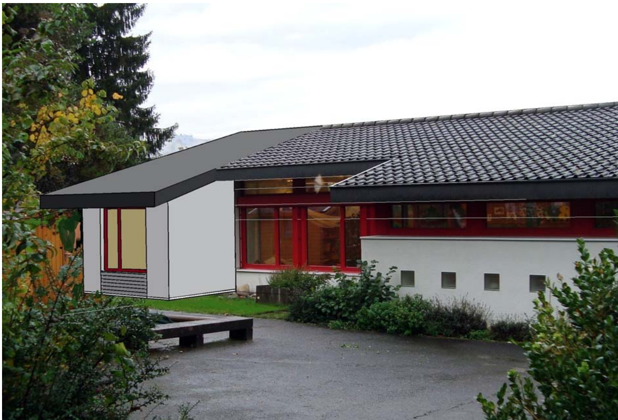
Fotomontage mit dem geplanten Anbau (links)

Wand- und Deckenisolation; Türen zum Teil sanieren bzw. ersetzen; Tür und Fenster zum Schutzraum; Malerarbeiten Boden-Wand-Decke-Türen-Fenster; Ersatz Leitungen Wasser und Heizung; Dämmungen; Ersatz Wasserverteilung und Zuleitung im Gebäude; Ersatz einzelner Komponenten zu Heizung; Ersatz Elektroverteilung und Installationen; Versetzen Einstiegsschacht zu Öltankraum; Anbringen Türe mit Lüftungsöffnung zu Tankraum; Versetzen Ölfüllleitung;