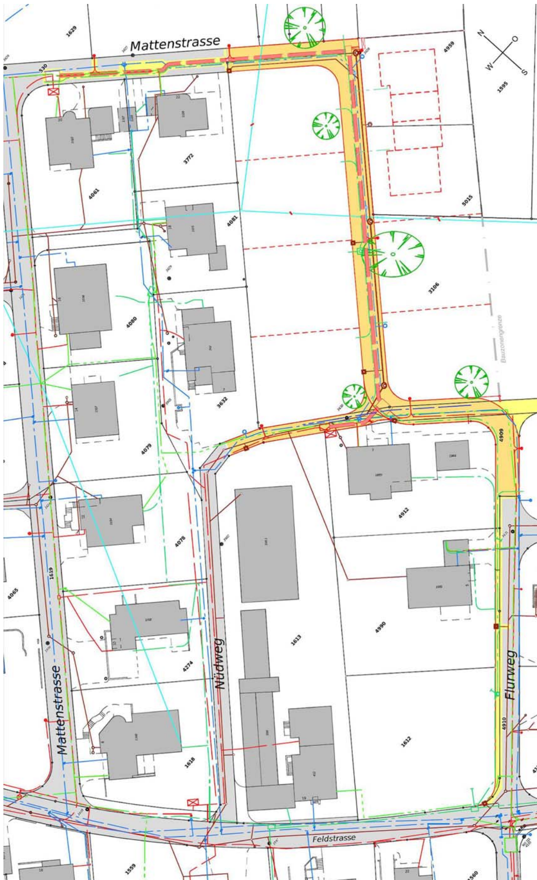
Situationsplan Erschliessung "Im Nüd"