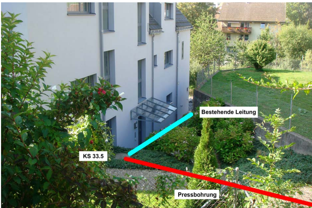
Lage der bestehenden Leitung bei Kontrollschacht KS 33.5