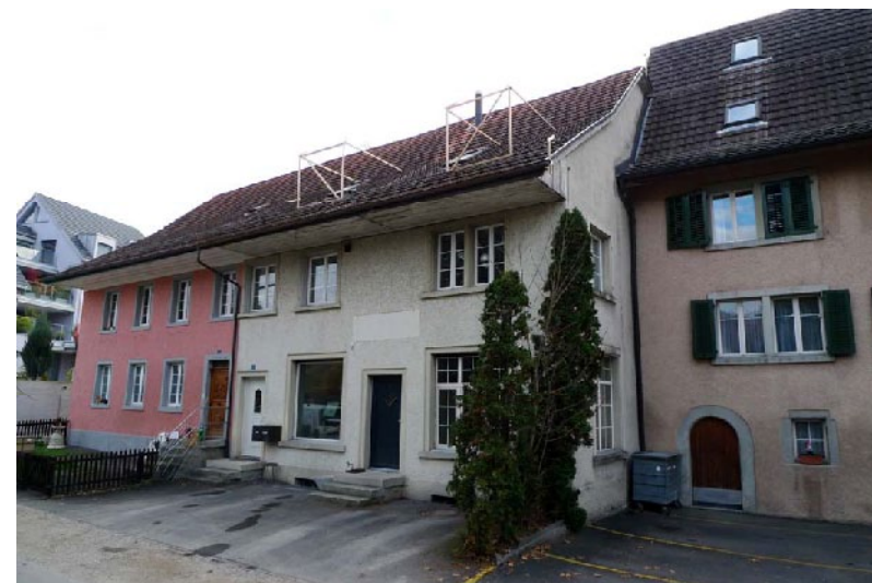
Das schützenswerte Ensemble mit den Häusern (von links) Mühlegasse 6 und Mühlegasse 4 und - angeschnitten - Mühlegasse 2.

Der Gemeinderat hat das Umbauprojekt durch einen ausgewiesenen Fachmann und Bauphysiker begleiten und von diesem eine Expertise erstellen lassen. Architekt und Bauherrschaft haben sich dabei sehr kooperativ gezeigt und waren trotz Mehrkosten bereit, auf die Anliegen der Gemeinde bezüglich Ortsbildschutz einzugehen.