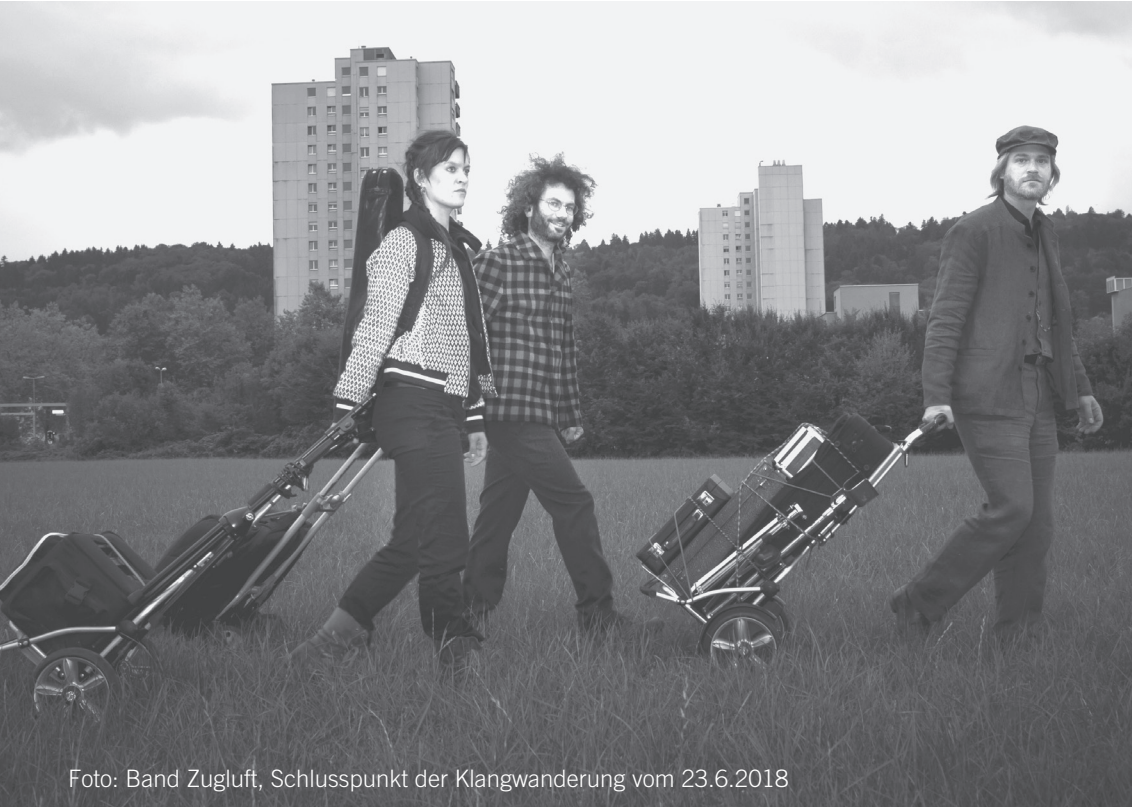
Foto: Band Zugluft, Schlusspunkt der Klangwanderung vom 23.6.2018