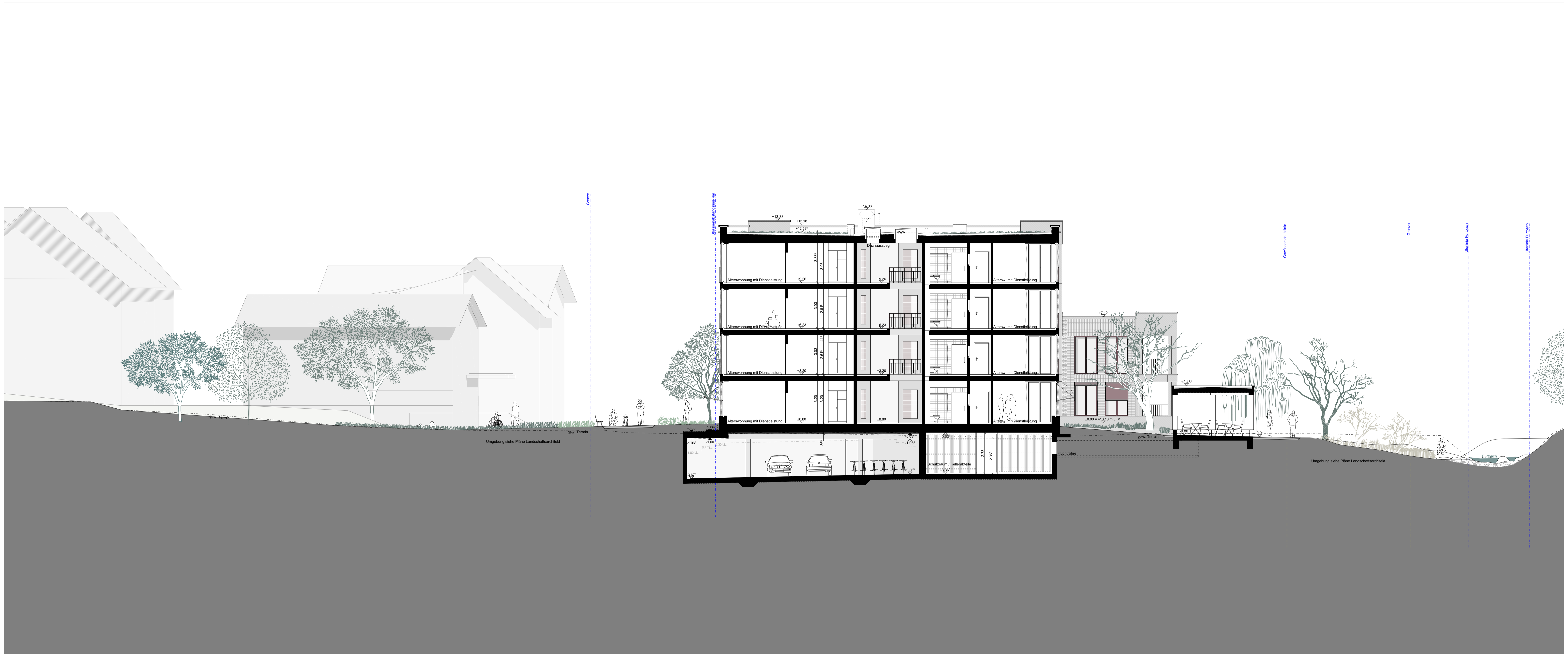
Querschnitt C-C, Haus C