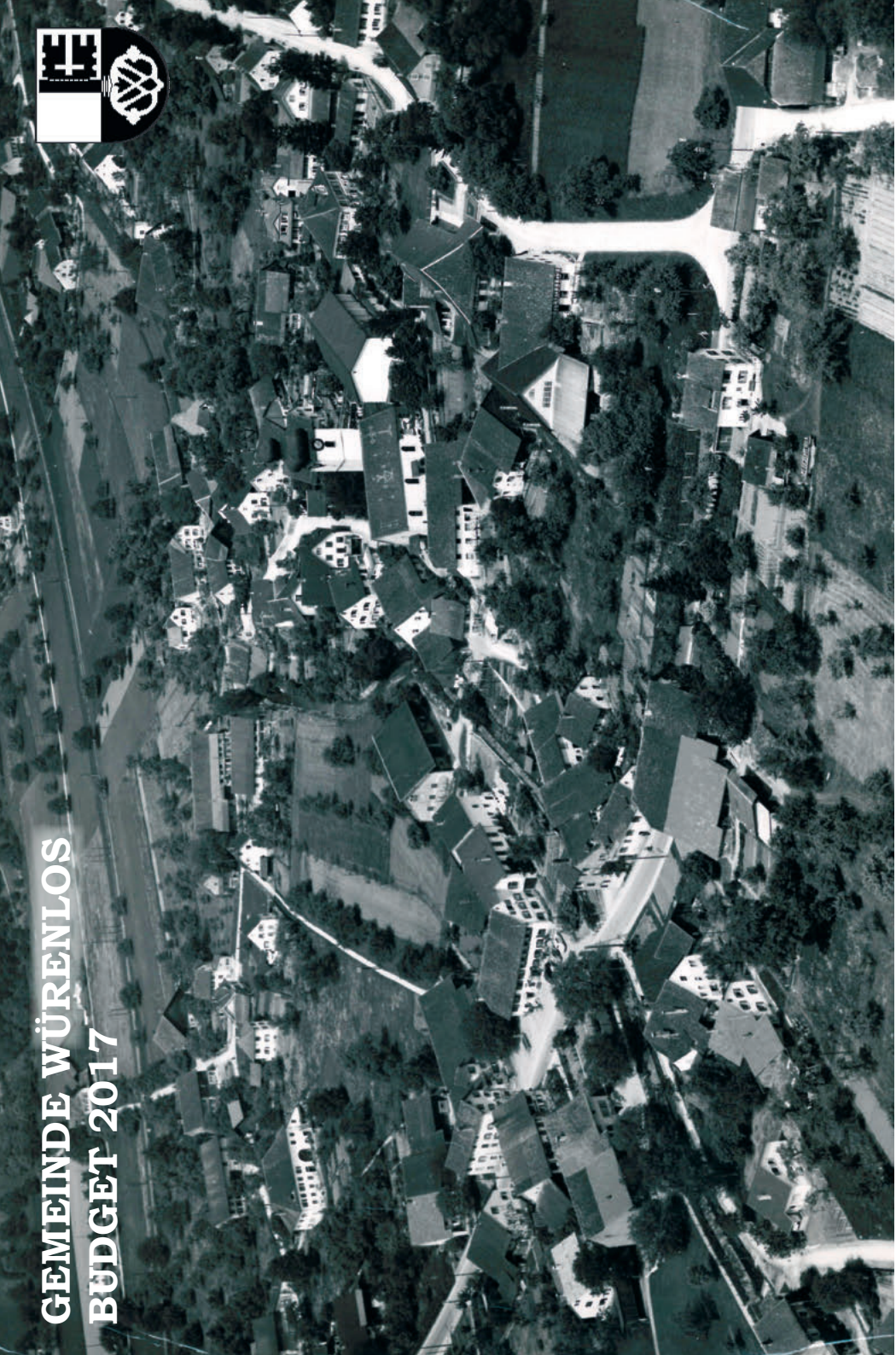
Dorfzentrum (Luftaufnahme um 1946)