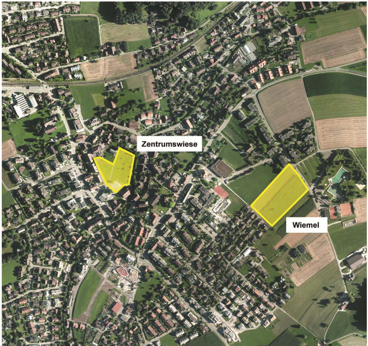
Mögliche Standorte für ein Alterszentrum