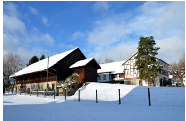
Gasthof "Steinhof" mit Saalanbau (links) und Scheune (rechts) im Dezember 2012