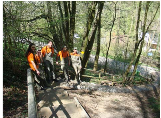
Zivildienstleistende im Einsatz: Wegbauer am Limmatuferweg (links) und Treppenbauer am Nashüttenweg.