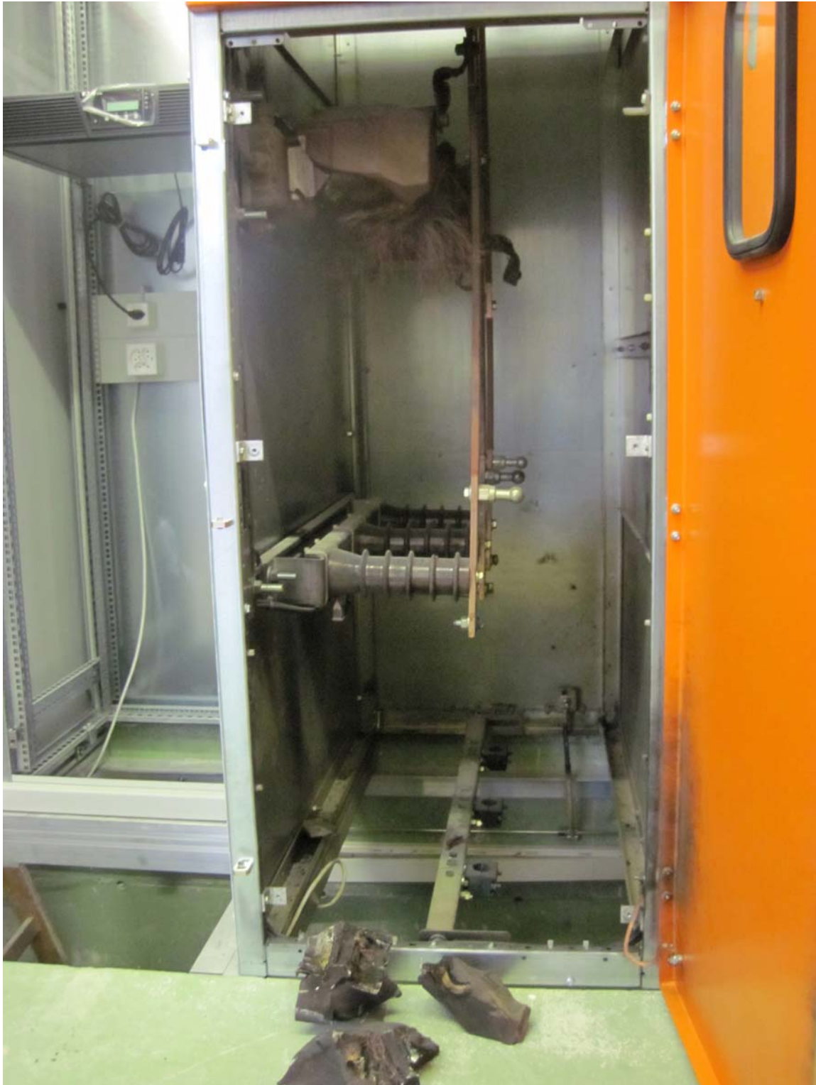
Mittelspannungszelle mit explodiertem Spannungswandler

GEMEINDEKANZLEI WÜRENLOS Der Gemeinbeschreiber