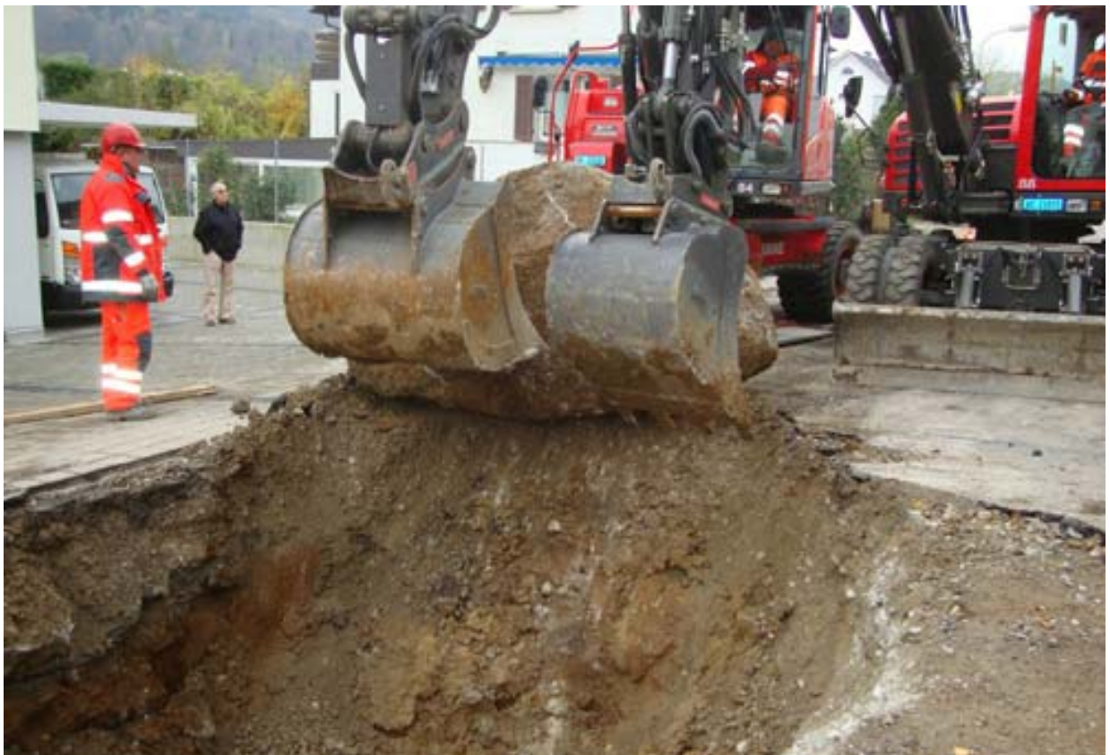
Findlinge am Schliffenenweg: Gleich zwei Bagger müssen anpacken, um diesen 10 t schweren Findling aus der Baugrube heben zu können.