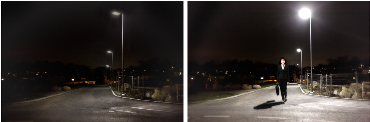
Intelligente Strassenbeleuchtung ohne (links) und mit Personenfrequenz (rechts)

Aus diesen Gründen hat der Gemeinderat auch den Grundsatzbeschluss gefällt, bei allen zukünftigen Strassenprojekten LED-Strassenlampen mit Bewegungserkennung einzusetzen.