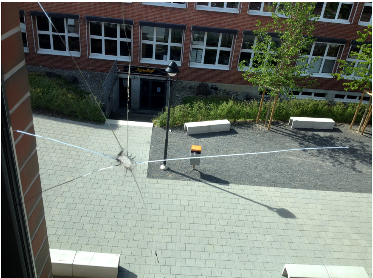
Kaputte Scheibe beim Schulhaus "Feld"

Erneuter Vandalismus auf dem Schulareal: Beim Schulhaus "Feld" wurde eine grosse Fensterscheibe beschädigt, vermutlich durch eine Steinschleuder. Die Tat erfolgte am Wochenende zwischen dem 9. Mai und 11. Mai 2015, 10.00 Uhr. Der Schaden beläuft sich auf mehrere tausend Franken. Die Gemeinde setzt eine Belohnung von 500 Franken aus für Hinweise, die zur Täterschaft führen. Hinweise nimmt die Gemeindekanzlei (Tel. 056 436 87 20; gemeindekanzlei@wuerenlos.ch) entgegen.