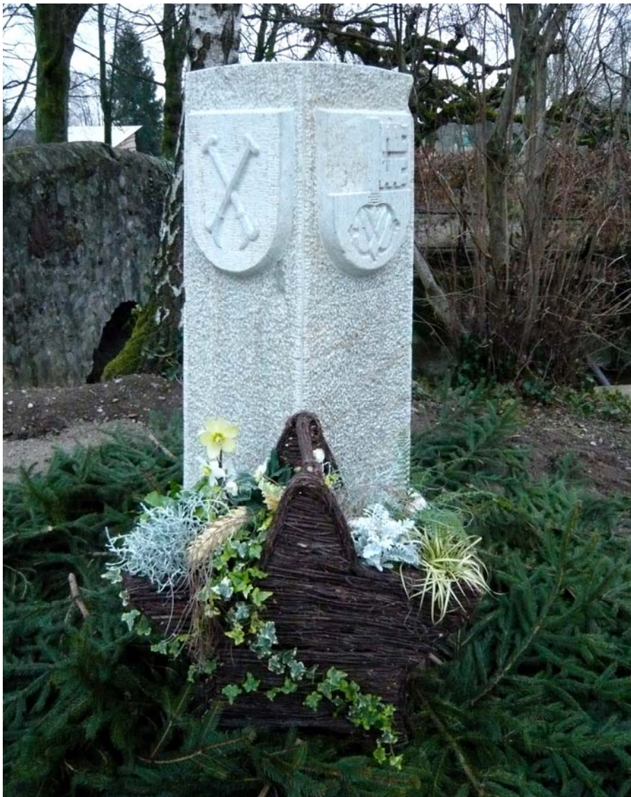
Grenzstein Kloster Fahr - Würenlos - Unterengstringen, eingeweiht am 1. Januar 2008

Über weitere Einzelheiten wird der Flyer informieren, der im Lauf des Dezembers an alle Würenloser Haushaltungen verteilt wird.