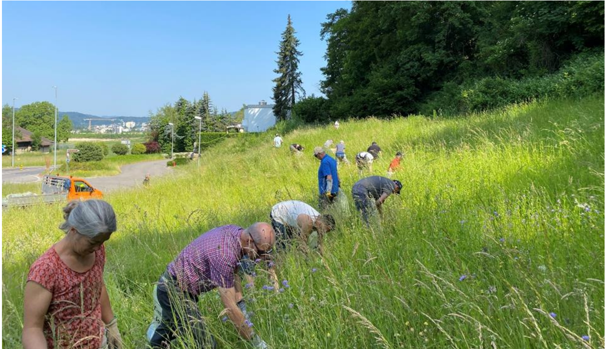
Die fleissigen Teilnehmenden an der Arbeit.

Der Gemeinderat dankt allen Teilnehmenden und den Organisatoren für ihren Einsatz.