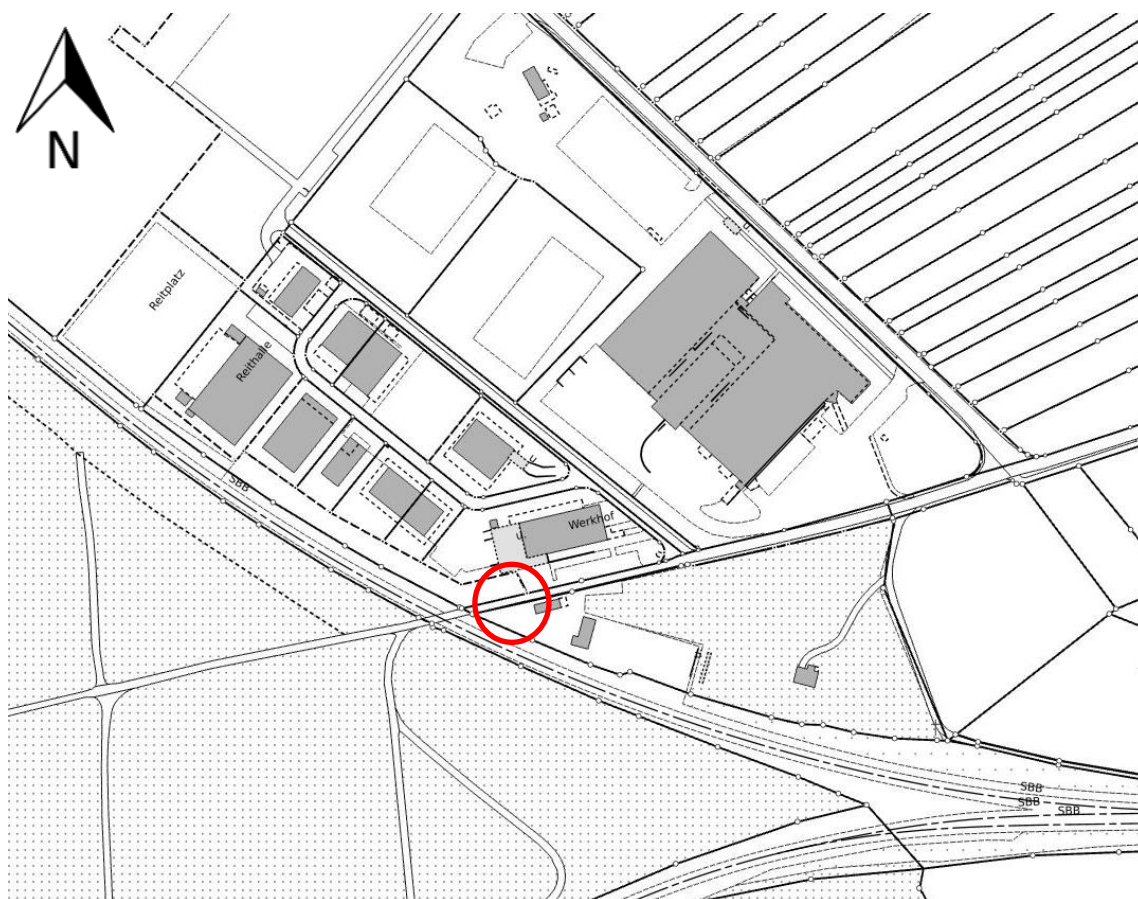
Abbildung 1: Standort des Pumpwerks Tägerhard

Der Erneuerung des Pumpwerkes erfolgte im Jahr 2023. Die letzten Anpassungen gemäss Auflagen AWA und Rückmeldungen Betreiber wurden Anfang 2024 abgeschlossen.